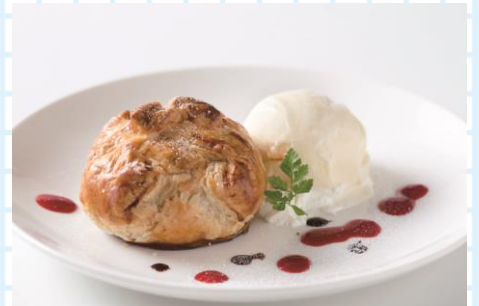
▲あったかアップルパイの バニラアイス添え