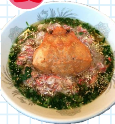
▲かにラーメン 850円(税込)