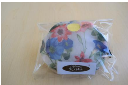
オーガンジー角ポーチ(小)500円