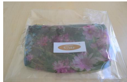
オーガンジー丸ポーチ(中)1,000円